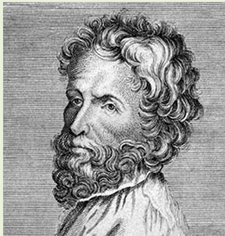
Tomás Luis de Victoria (1548 – 1611)