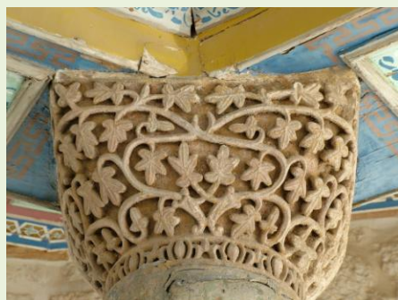
Gerusalemme: incontro di fedi e culture

Il tema di quest'anno dunque, sarà la Città Santa per antonomasia, una vera protagonista dell'epoca medievale e una straordinaria fonte di ispirazione poetico-musicale per il Rinascimento. Elementi questi che ci hanno offerto l'occasione per articolare un programma che toccherà molti aspetti, a partire dalle musiche e dai versi generati dall'ideale di conquista della città che fu teatro delle gesta di Cristo, per approdare al concetto di "Gerusalemme celeste" passando attraverso la "Gerusalemme terrena" dell'edificazione di luoghi di culto e alla musica connessa all'occasione.